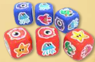
6 dés Kraken (3 violets et 3 rouges)