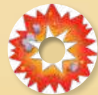
3 jetons Kraken Attack