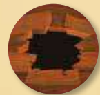
4 jetons Trou