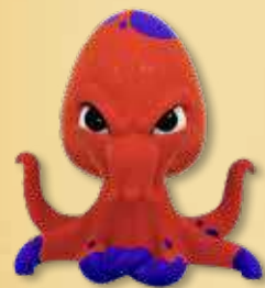
1 figurine Kraken

*Chaque zone du bateau couvre 2 couloirs de Tentacules.