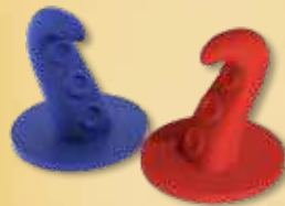
8 figurines Tentacule (4 violets et 4 rouges)