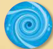
4 jetons Tourbillon (pour la variante, voir p.6)