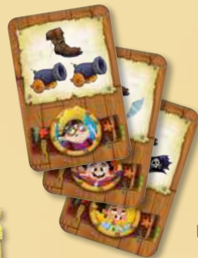
40 cartes Action