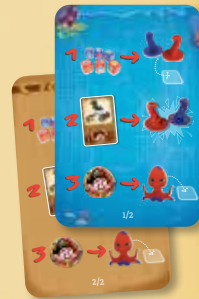
4 cartes Aide de jeu